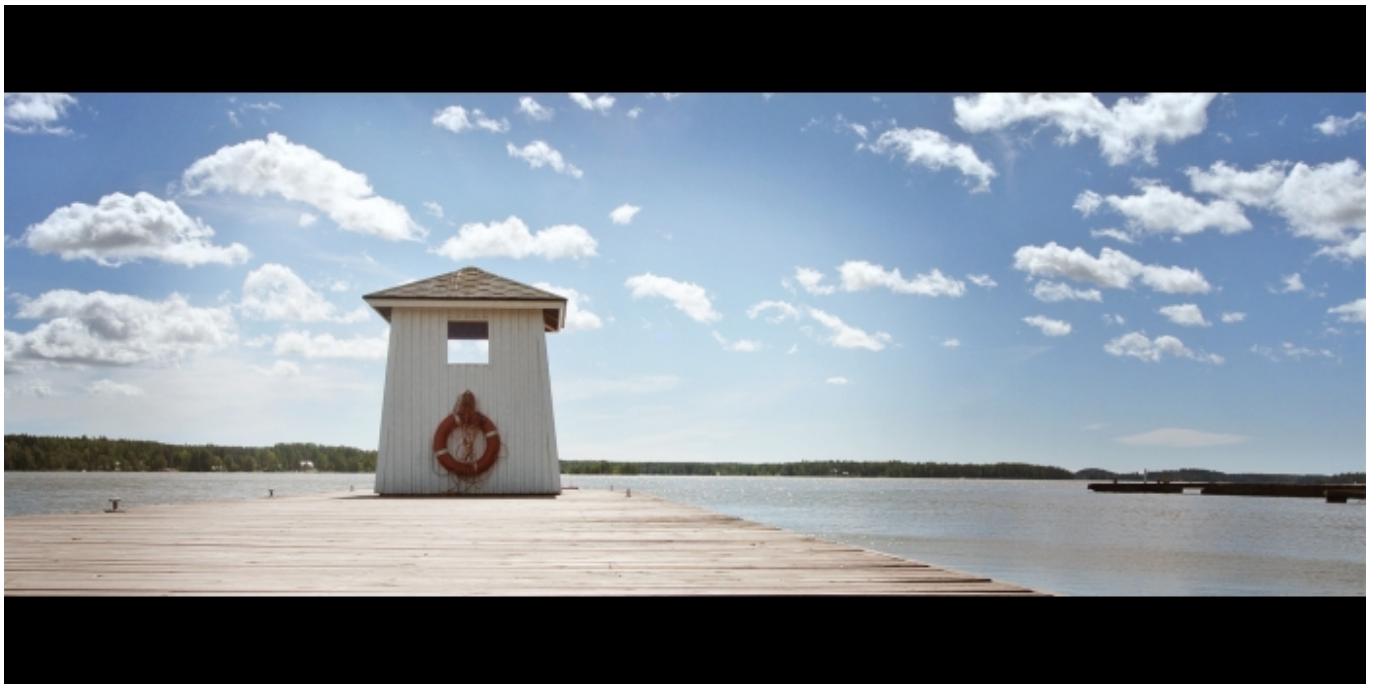
Мостик отеля Хайкко, Порвoo, Финляндия