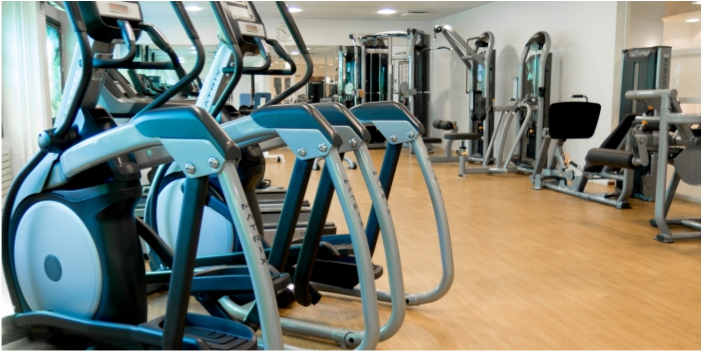
Фитнес-зал отеля Хайкко, Финляндия